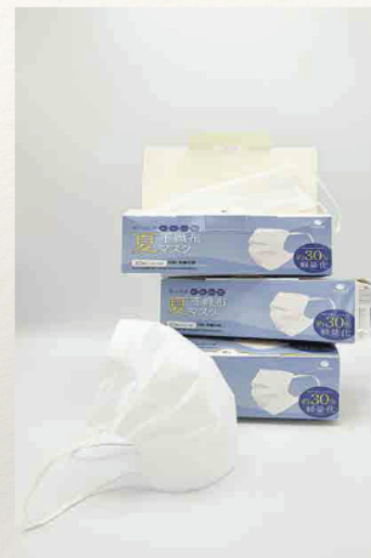
夏用マスク (使い捨てタイプ)