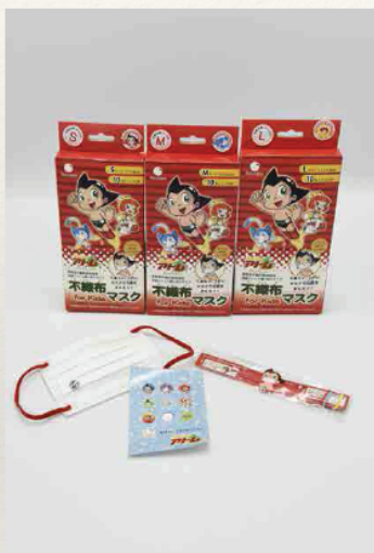
アトムマスク (キッズ)